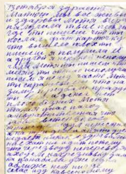
Письмо с фронта из станицы Аксайской 1942 г.