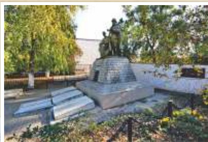
Братская могила-мемориал ст. Ольгинская

С уважением, Депутат Законодательного Собрания Ростовской области Саркис Гогорян