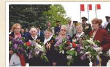
Братская могила п. Дорожный