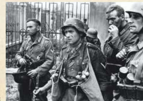
Бойцы военной пехоты

И именно поэтому мы должны благодарить их за Победу.