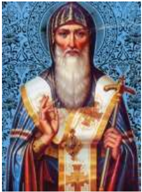
Святитель Иларион «Слово о Законе и Благодати»