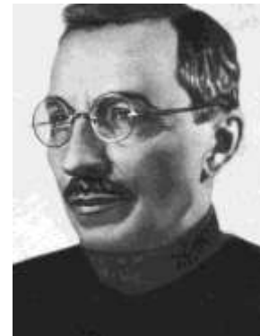
Антон Семенович Макаренко (1888 -1939) «Педагогическая поэма»