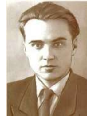
Василий Александрович Сухомлинский (1918-1970) «Сердце отдаю детям»