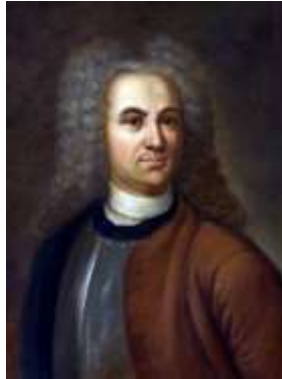
Василий Никитич Татищев (1686 -1750) «Разговор о пользе наук и училищ»