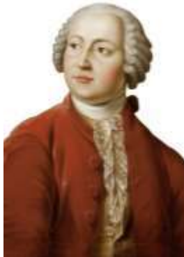
Михаил Васильевич Ломоносов (1711 -1765) «Регламенты», «Российская грамматика»