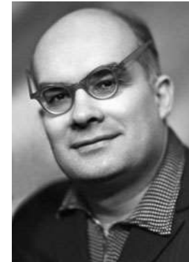
Игорь Петрович Иванов (1923 — 1992) «Коллективное творческое воспитание»