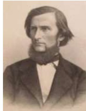
Константин Дмитриевич Ушинский (1823 -1870) «Человек как предмет воспитания»